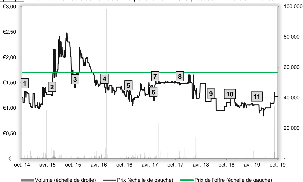
Graphique : Evolution du cours de bourse sur la période 2014-2019 précédant la Date d'Annonce

Il est précisé que l'évolution du cours de bourse sur les six derniers mois est marquée par une faible liquidité, avec 113 journées de négociation présentant uniquement des transactions de valorisation (acheté-vendu) du contrat de liquidité sur les 129 dernières journées de négociation précédant la Date d'Annonce.